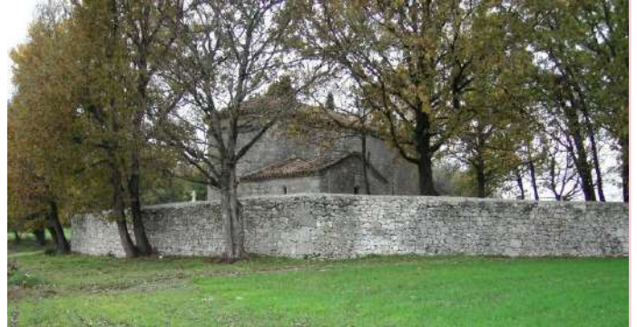
Eglise de Saint-Thomas dans son écrin de verdure