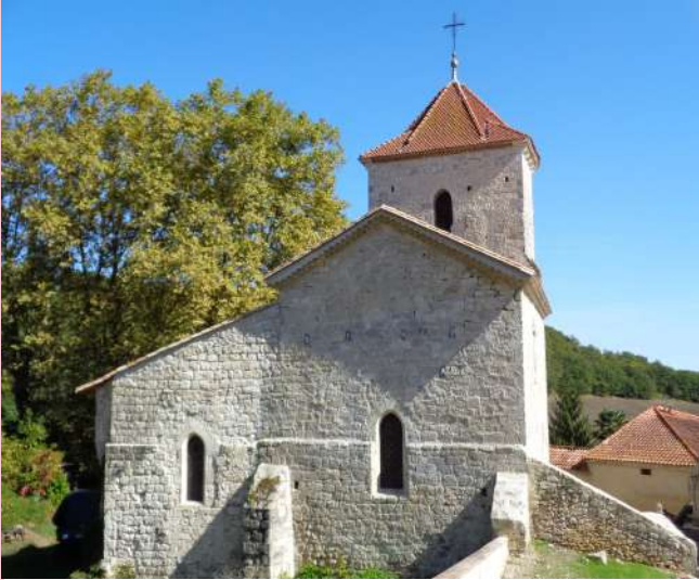
Eglise de Saint Just

La richesse des monuments historiques et religieux de la commune attirent toujours autant de monde. Cette année, sur le week-end quelques 200 visiteurs ont découvert ou redécouvert le patrimoine hautefageois.