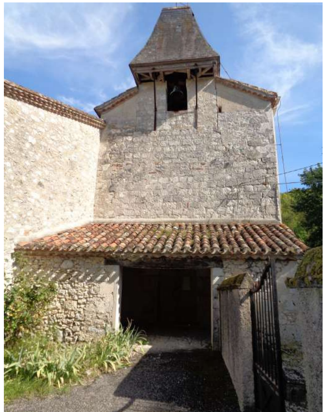
Eglise de Bonneval