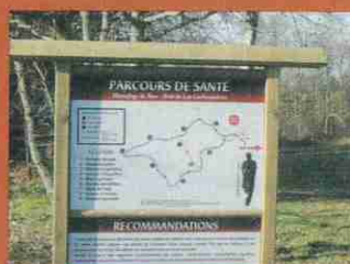
Parcours de santé au Bois de Las carbounières

Le 28 novembre, une après-midi découverte avait été organisée par le Comité des fêtes à laquelle vous avez été nombreux à participer.