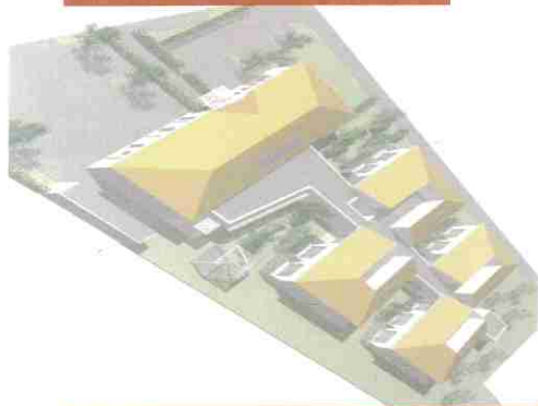
Première esquisse de la future MARPA

À la rentrée scolaire 2014-2015, l'école Georges Brassens avait bénéficié d'un poste d'enseignant supplémentaire pour faire face aux effectifs en constante hausse. Dans l'urgence, la commune avait alors installé la classe de CE1 dans le seul bâtiment communal dont elle disposait. Cependant, cette organisation pose malgré tout quelques