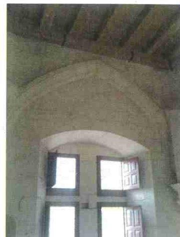
Fenêtre du 1er étage

sur cette dernière tranche de travaux. Le montant total des travaux y compris un aménagement extérieur du parvis et la mise en œuvre d'un escalier en pierre s'élèveront à 297 450 €, subventionnés à 78,75 % par l'Etat, la Région et le Département.